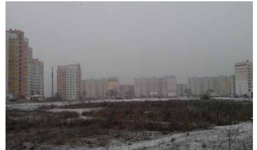
На фота вул. Златаўстаўская - месца для садка і школы

- Маладых сем'яў на раёне шмат. Некаторыя з іх думаюць пра другога і трэцяга дзіця. Калі ж не будзе інфраструктуры і трэць дні будзе займаць працэс адвозу і забаранна дзіця з садка, то не кожны з маладых бацькоў адважыцца на павелічэнне сваіх сем'яў. Горад павінен быць для грамадзянаў і мусяць быць зручным, а чыноўнікі мусяць ствараць для гэтага усе ўмовы, - гаворыць Ігар Барысаў.